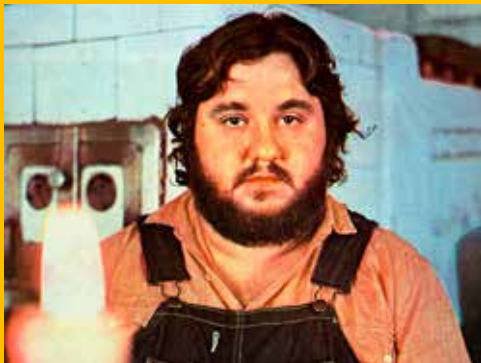
Tučňáci, Michal Tučný, 1982