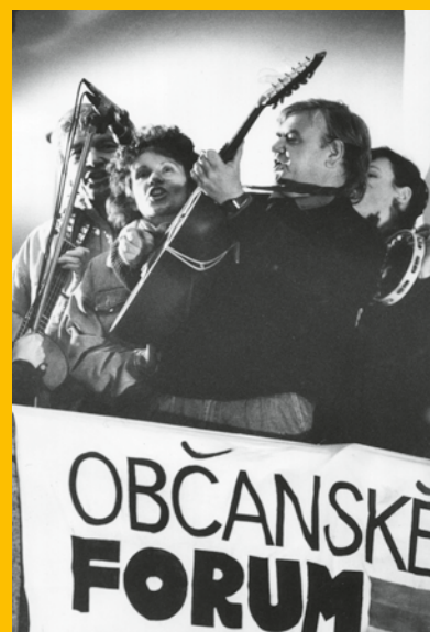
Spirituál kvintet, 1989

underground, vznikla Charta 77, sotva inicioval anti-chartu, vzedmula se nová vlna rocku. Jakmile zašlapal Jazzovou sekci, sesypala se na něj kritika ze zahraničí. Z rukou se mu vymkl i festival Rockfest, který se dokonce prostřednictvím svazáků pokoušel sám pořádat. Byli to často právě pop muzikanti, kteří „zlobili“, propašovali na pódium spiklenecké komentáře, iniciovali či podepisovali petice a pak hráli na demonstracích.