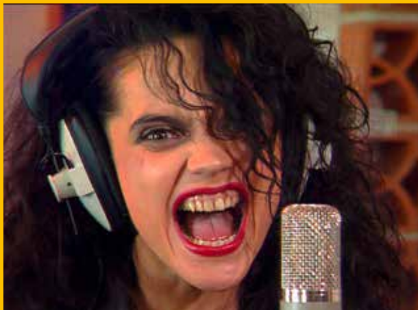
Lucie Bílá, 1992