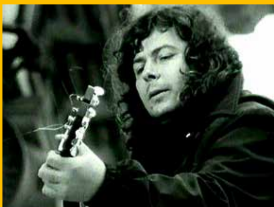
Etc..., V. Mišík, O sochách mezi sochami, cca 1981