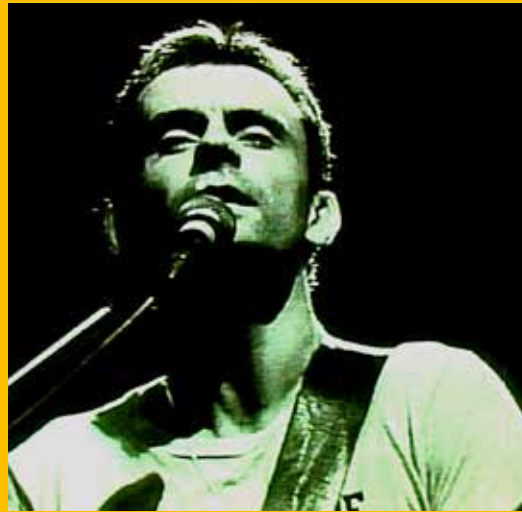
Elán, baskytarista a zpěvák Jozef Ráž, cca 1986–87