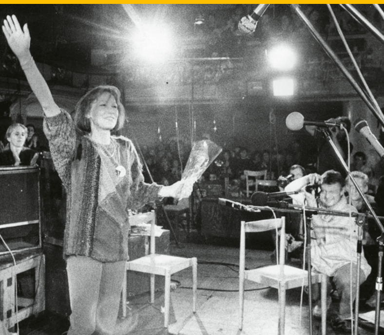
Marta Kubišová, 1989